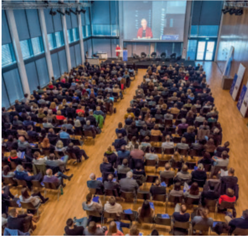
Das Symposium fand im RheinMain CongressCenter RMCC in Wiesbaden statt.

Das Europa der Metropolen, die Infrastruktur von China und den USA, Ludwig Hilberseimer, New Towns oder Blockchain: Die Architekten- und Stadtplanerkammer Hessen (AKH) als Veranstalter des Symposiums, das diese Themen und noch viele mehr ansprach, dachte wohl selbst nicht daran, einen roten Faden in all diesen Inhalten ausmachen zu können. Aber das war auch egal. Sie feierte 50. Geburtstag. Mit einer Party und mit einer Konferenz namens „Räumliche Reflexion / reflexive Räume“. Man gönnte sich, einmal weit über den Architekten-Alltag hinaus zu denken, keine Lösungen zu haben, sondern zunächst Fragen zu stellen. Den Mut, eingefahrene Prozesse und Begriffsbilder zu hinterfragen, den AKH-Präsidentin Brigitte Holz von Politik und Planerbranche einforderte, bewies die Kammer selbst mit diesem Symposium.