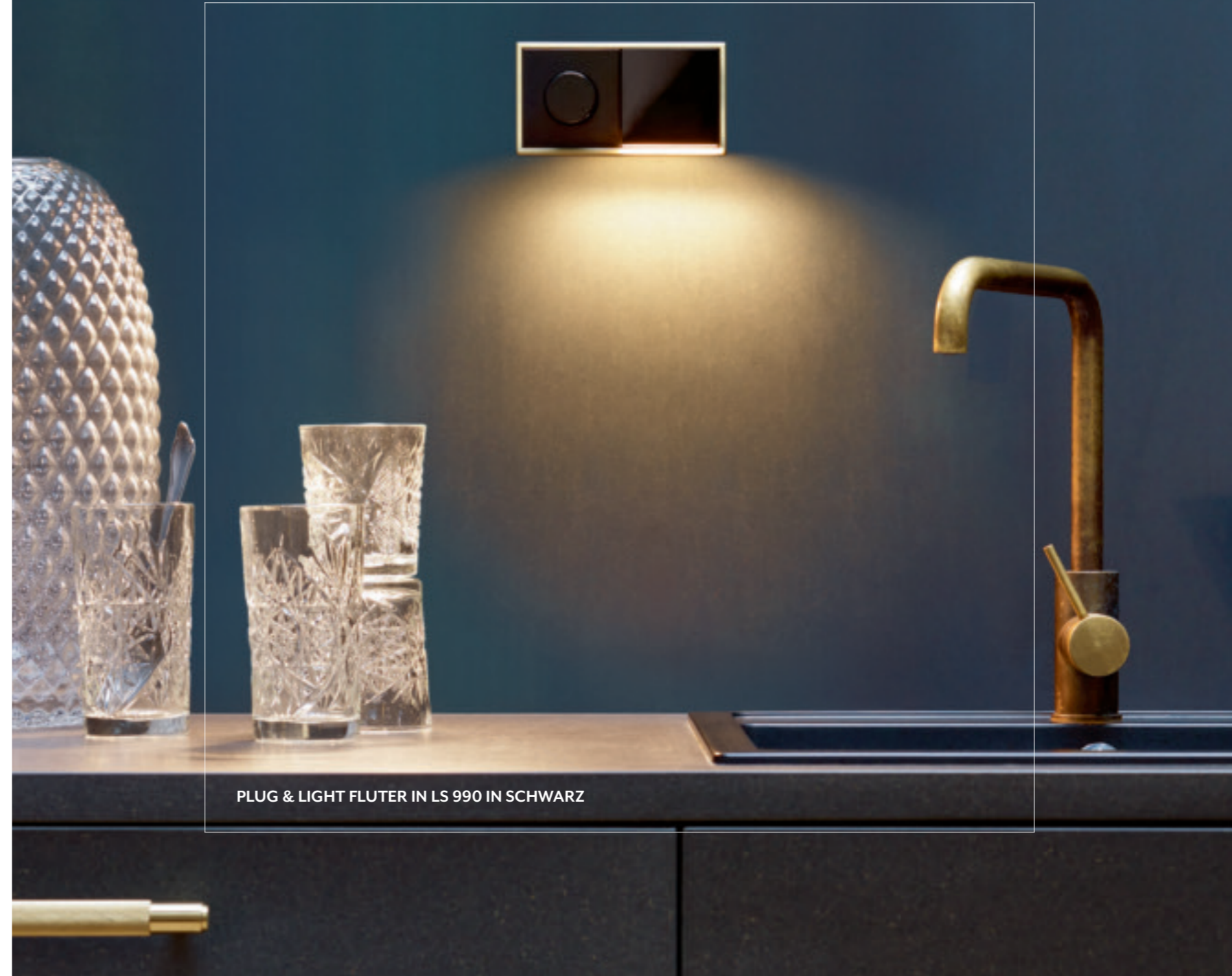
PLUG & LIGHT FLUTER IN LS 990 IN SCHWARZ